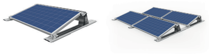
IBC AeroFix 15